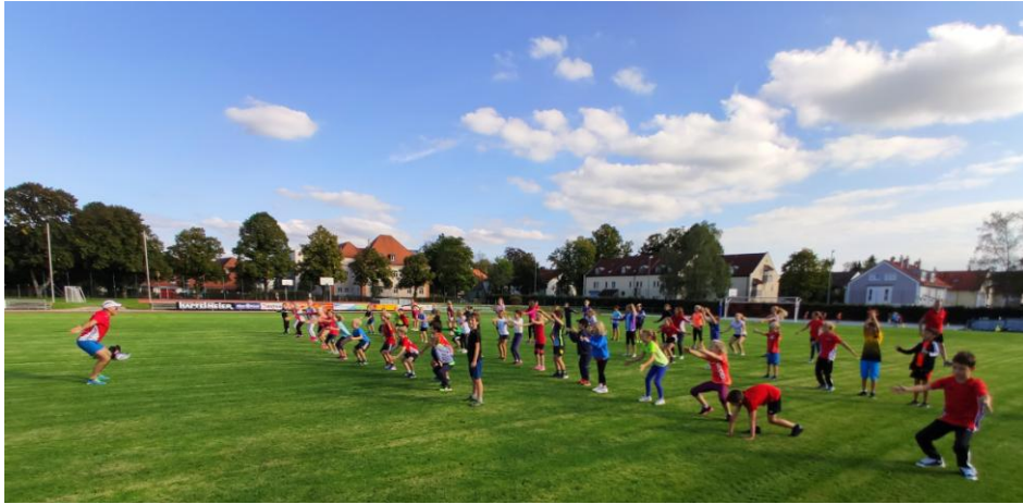
Ein Foto aus 2019 zum Träumen ...

Nach den Sommerferien 2020 schien die Welt wieder im Lot zu sein. Alle Sportler durften - mit ein paar Vernunftregeln - zusammen sporteln. Bis zu den Herbstferien genossen wir Leichtathleten daher einen herrlichen Spätsommer im TSV-Stadion. An Wettkämpfen konnten wir zwar nicht mehr teilnehmen, da alle Veranstalter ihre Wettbewerbe abgesagt hatten. Auch unsere traditionellen Teilnahmen am Hapfelmeierlauf und FUBSI-Silvesterlauf konnten wegen deren Corona-bedingten Absagen nicht stattfinden. Dafür nutzten wir jede Trainingseinheit bis zum Spätherbst.