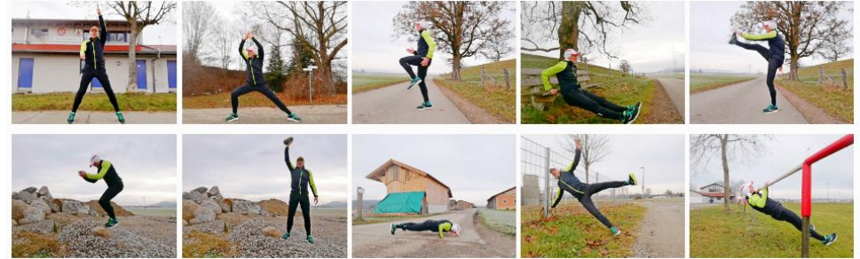
Corona-Challenge CrossGym Training