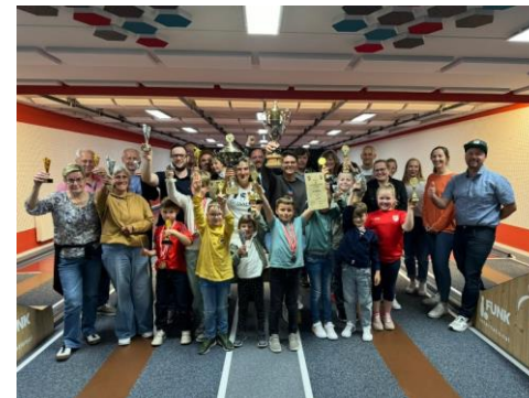
Die Sieger der Stadtmeisterschaft: Strahlende Gesichter nach einem spannenden Turnier, das jährlich allen interessierten und ambitionierten KeglerInnen offensteht