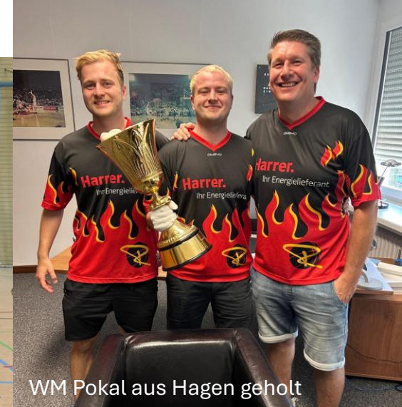
Gemeinsam im EM-Fieber