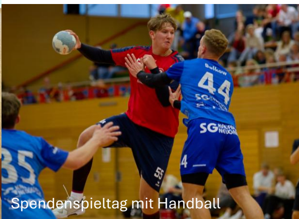
Spendenspieltag mit Handball